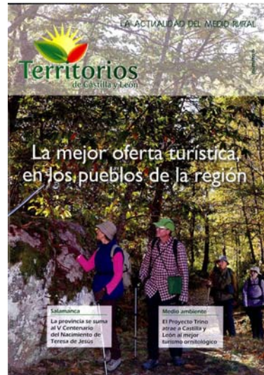
Nº 6 Revista Territorios- Octubre 2014

La revista numero seis describe nuestro territorio, ubicado en una encrucijada de ríos, condición ideal para observar mas de 40 especies de aves características en ambientes acuáticos. Contamos con dos rutas ornitológicas para el avistamiento de estas aves.