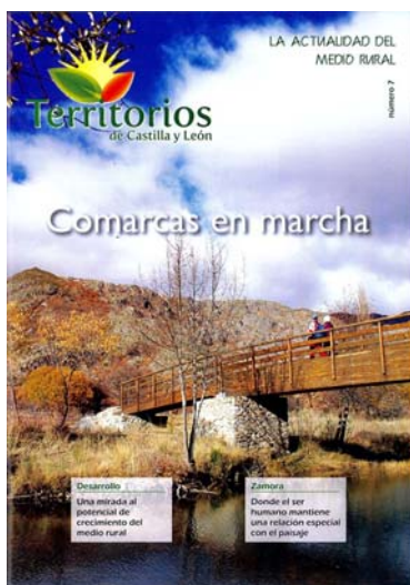
Nº 7 Revista Territorios- Enero 2015

En esta ocasión la publicación hace referencia a los recursos agrícolas, ganaderos y silvícolas para el desarrollo de los Valles de Benavente